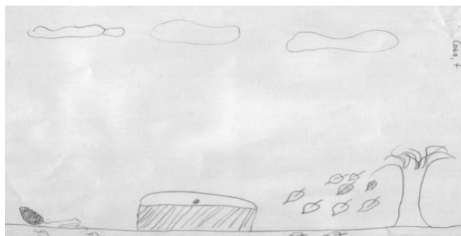
Цртеж 2. „Смрт”, С. С. (7 г.)

цртежима седмогодишњака доминира емоција. На Цртежу 2, који припада девојчици од седам година, као што можемо видети, налази се гроб, иза гроба је дрво са кога пада лишће. На цртежу доминира осећање туге. На једном другом цртежу нацртана је девојчица поред гроба са цветом у рукама. На лицу девојчице туга је представљена кривом линијом усана надоле.