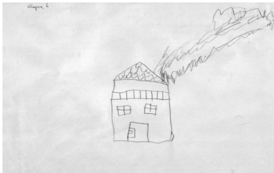
Цртеж 3. „Кућа смрти” Ж. Ж. (6 г.)

Утицај искуства детета са смрћу остварио је различити утицај на визуелну представу смрти код деце различитог узраста. Сви седмогодишњаци који су имали искуство са смрћу на својим цртежима цртали су смрт, и то тако што су најчешће цртали споменике, гробље или сахрану. Од петоро шестогодишњака која су имала искуство са смрћу, смрт је цртало двоје. Код петогодишњака троје је имало искуства са смрћу, а двоје ју је кроз своје цртеже и представило.