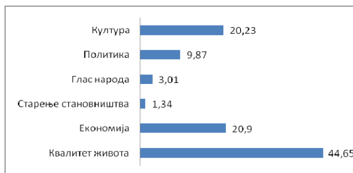
Графикон 1. Структура анализираних текстова тематским областима (у %)

Највећи број текстова односио се на питања квалитета живота (скоро половина), док су најмање били заступљени написи о старењу становништва. Квантитативна структура текстова по тематској разноврсности може се представити на следећи начин: квалитет живота (44,65%), економија (20,9%), старење становништва (1,34%), глас народа (3,01%), политика (9,87%), култура (20,23%) (Графикон 1). Вредна помена је приметно висока заступљеност текстова из области културе.