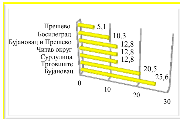
Grafikon 3: Pčinjski okrug (%)

U Pčinjskom okrugu se takođe pisalo o svim pograničnim opštinama (39 tekstova), ali je najveći broj tekstova o opštini Bujanovac (10 tekstova, odnosno 25,6%). Sledi opština Trgovište (osam tekstova, 20,5%), opština Surdulica (pet tekstova, 12,8%), opština Bosilegrad (četiri teksta, 10,3%) i na kraju opština Preševo (dva teksta, 5,1%). U pet tekstova opština Bujanovac i opština Preševo zajedno (grafikon 3).