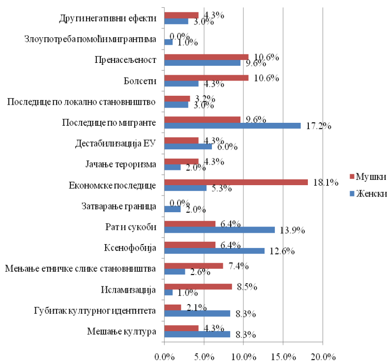
График 4. Пол и први избор негативних ефеката интеркултурне размене имиграционих токова у ЕУ

Хи квадрат тест независности упућује на констатацију о постојању статистички значајне повезаности између посматраних варијабли ( \chi^2 = 57.147 , p = 0,000 ), тј. између варијабли „пол” и „први негативни избор”. Утврђен је средњи утицај ( V = 0,38 ).