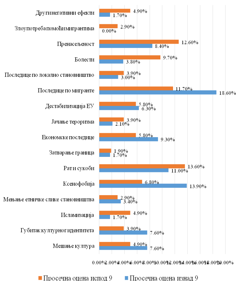
График 3. „Први негативни избор” са просечном оценом изнад и испод 9

Приказ одговора на питање „први негативни избор” испитаника са просечном оценом изнад 9 и испитаника са просечном оценом испод 9