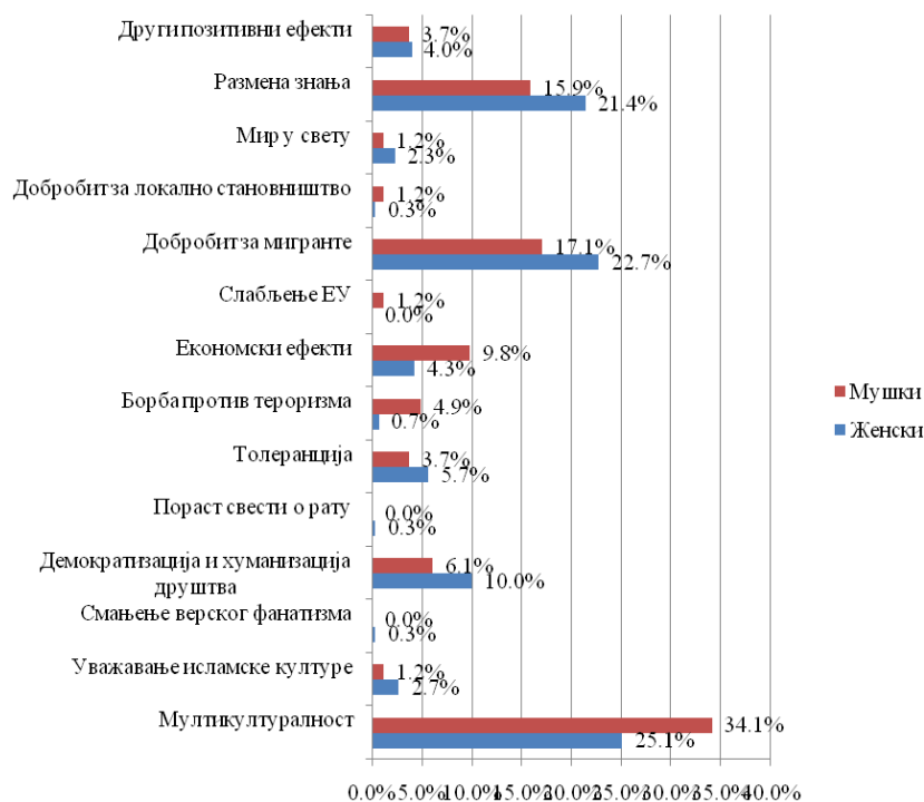
График 2. Пол и први избор позитивних ефеката интеркултурне размене имиграционих токова у ЕУ

Друга хипотеза односила се на значај пола као предиктора за интеркултурну осетљивост. Хи квадрат тестом независности констатована је статистички значајна веза ( \chi^2 = 22.280 , p = 0,05 ) између варијабли „пол” и „први позитивни избор”. Дакле, претпостављало се да ће студенти у односу на пол различито реаговати на питања о ефектима интеркултурне размене имиграционих токова у ЕУ.